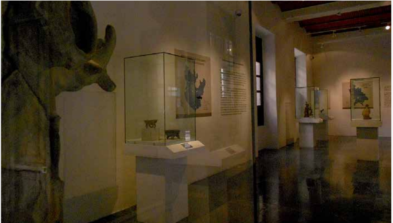
Exposición “Los Secretos del barro, la expresión de la cerámica en Colima y Nayarit” Cerámica de Colima, piezas monocromas en tonos anaranjados rojizos que se encontraban en las tumbas de tiro... Museo de Arqueología de Occidente

Consulta las convocatorias completas en www.jalisco.gob.mx/cultura